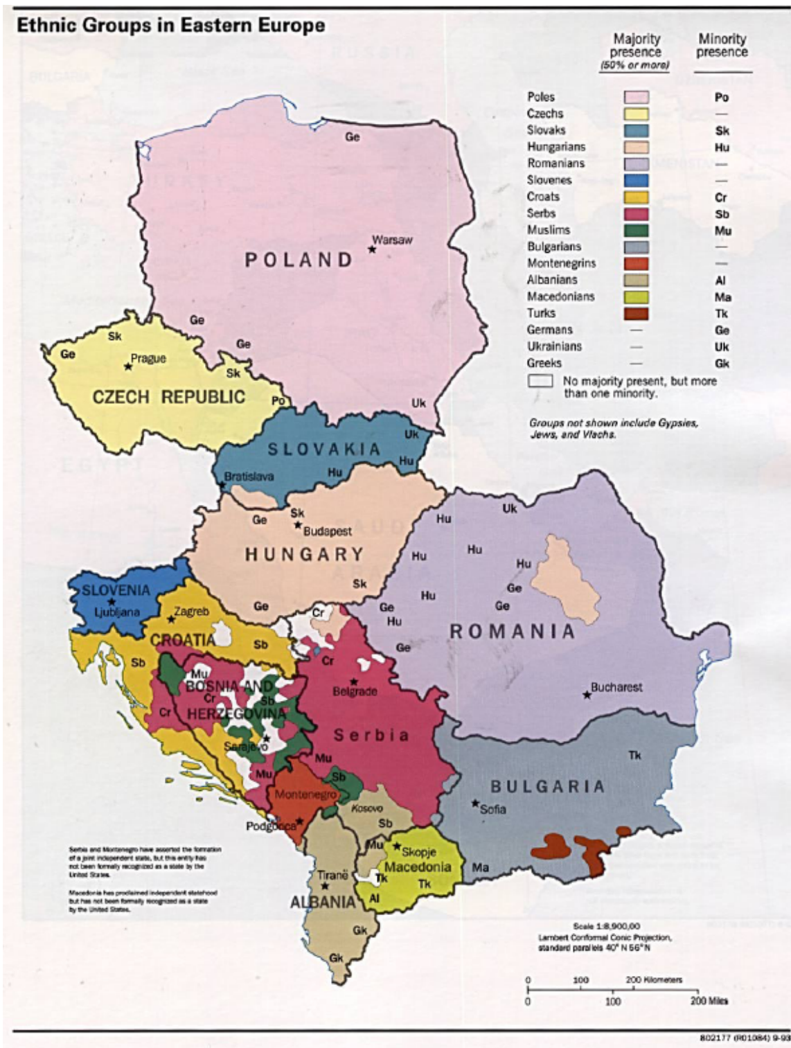
Doğu Avrupa'da Etnik Gruplar 7