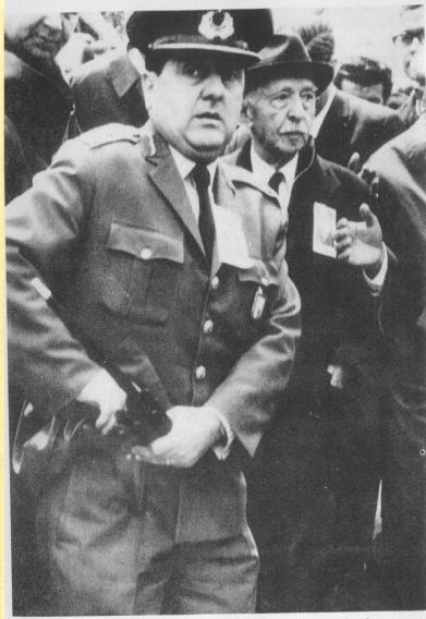
Mayıs 1969. Yarıştay başkanı İsmet Ökten'in emrazı nedeniyle kaldırılmak istemeyen yobak görüşüne karşı, ilk Türkiye Cumhuriyeti'nin barışçılardan İsmet İsmet'i yâ edilecek kararında.

* "Tanrı" idesinin, Descartes felsefesinde "Archievedes Noktası" olmasının sebebi budur: "Tan-